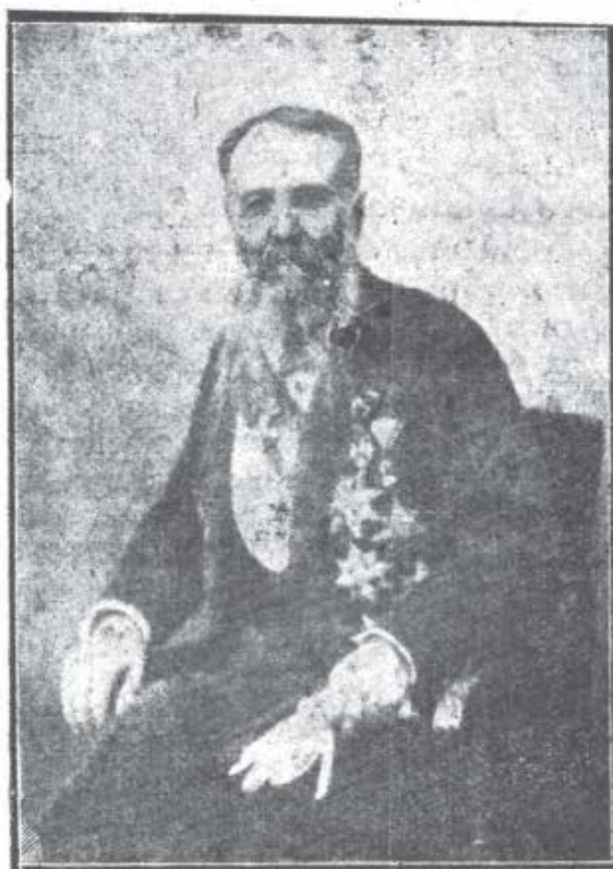
Никола Пашић Преседник Министарства

Он народу није давао, да он сам кандидује Народне Посланике, јер се је он такoвних посланика бојао.