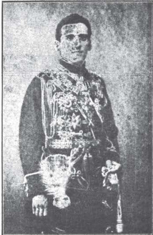
Вануставни Престолонаследник српски Александар Кара-Ђорђевић.

Нешколован, амбициозан, који ни најелементарнијег појма о народу нема, нити о својим владалачким