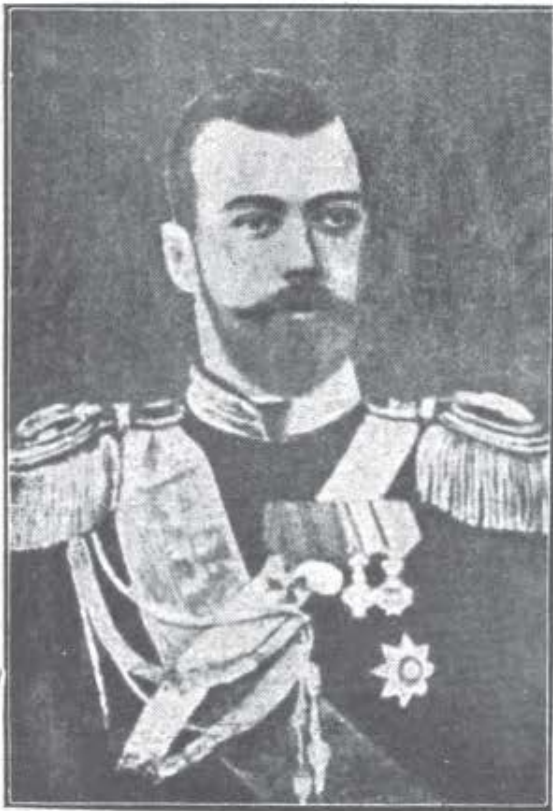
Руски цар Никола II.

Зар није српска Влада, газећи у овај непотребан и до крајности штетан рат по будућност Србије, кварећи онако колосално јаке везе, о којима се сањало још у XIV веку, учинила право безумље и фактично убиство српског народа.