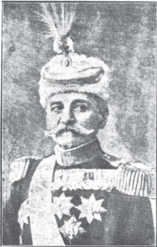
Радикално-заверенички харамбаша у Србији Петар Карађорђевић

То је једино што би се дало оправдати и одобрити. Све остало то је лаж.... али се је та лаж морала да трпи под претњом бајонета!!