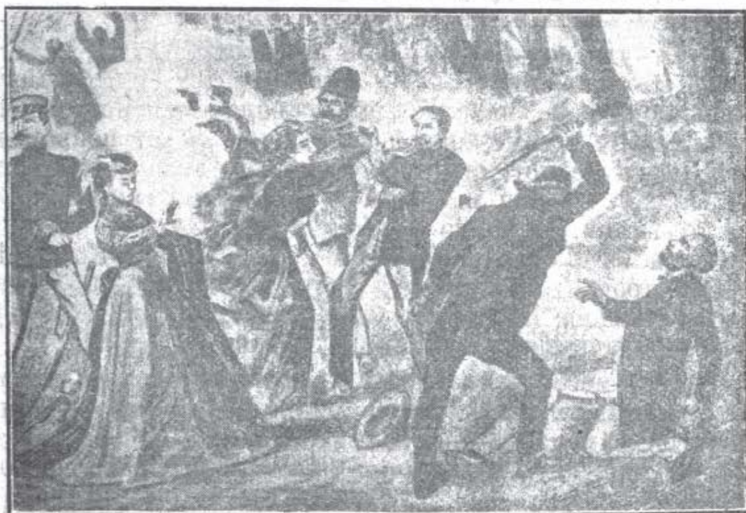
Мучко убиство Кнеза Михаила у Топчидеру 29 маја 1868 год., због кога је Александар Карађорђевић осуђен на 8 године робије, а Петар Карађорђевић на смрт!!...

У Женеви живео је интимно-пријателски, са руским кнезом Олденбургом.