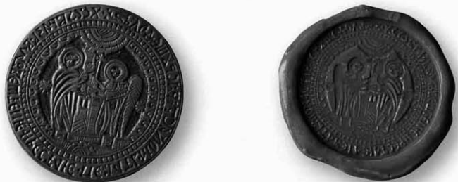
Метални печат манастира Крушедол с отиском