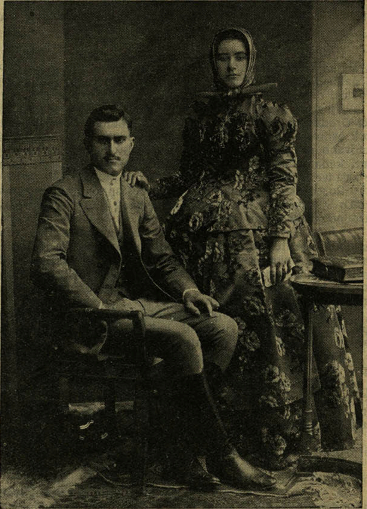
Bunjevački momak i divojka prije 30 godina