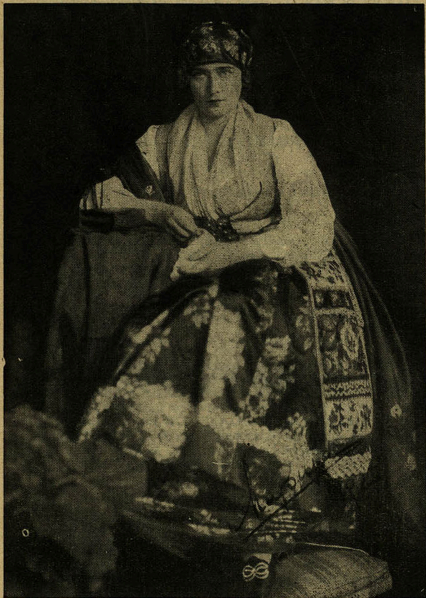
Njeno Veličanstvo Kraljica MARIJA