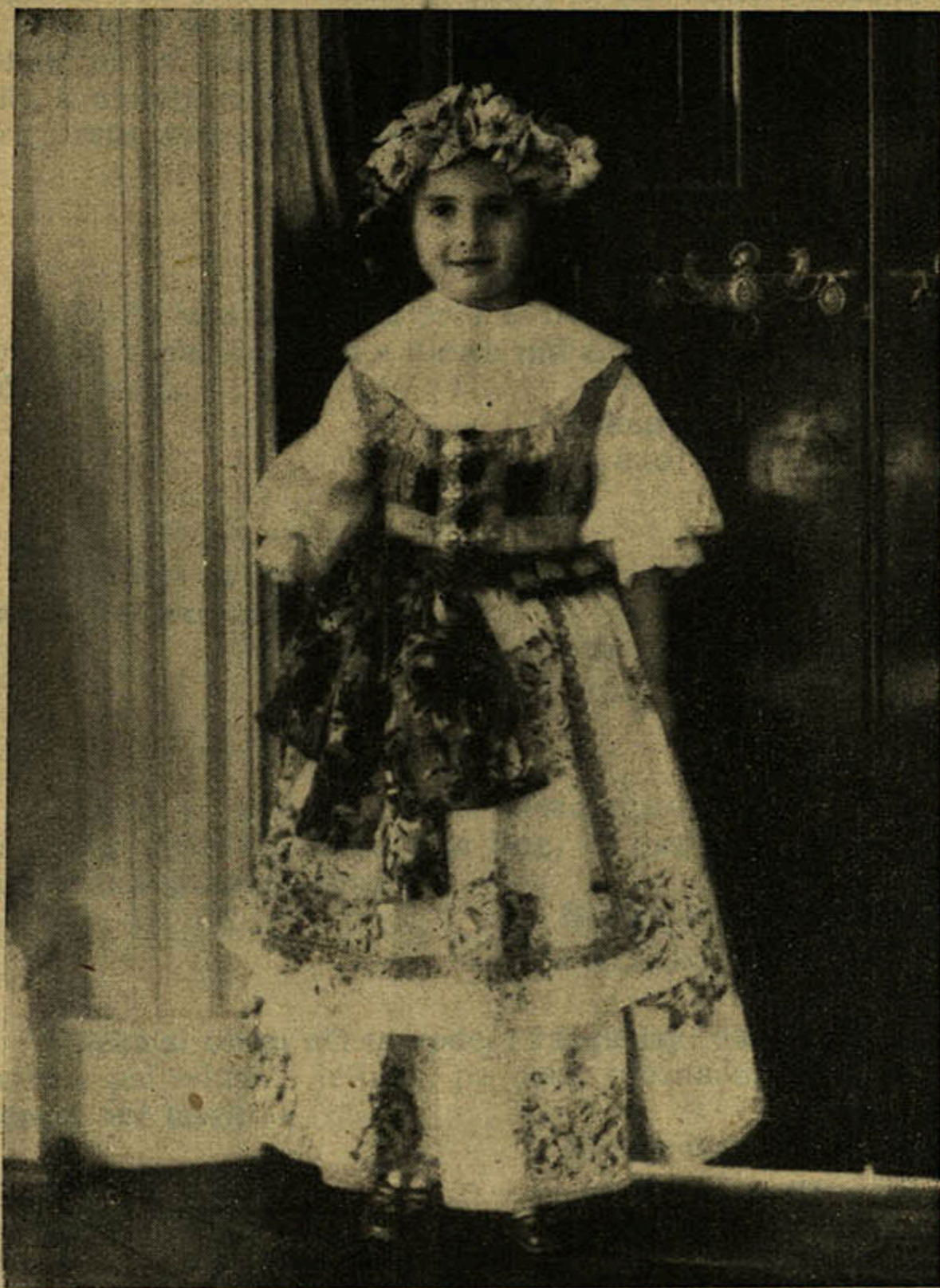
Njeno Kraljevsko Visočanstvo Knjeginjica JELISAVETA