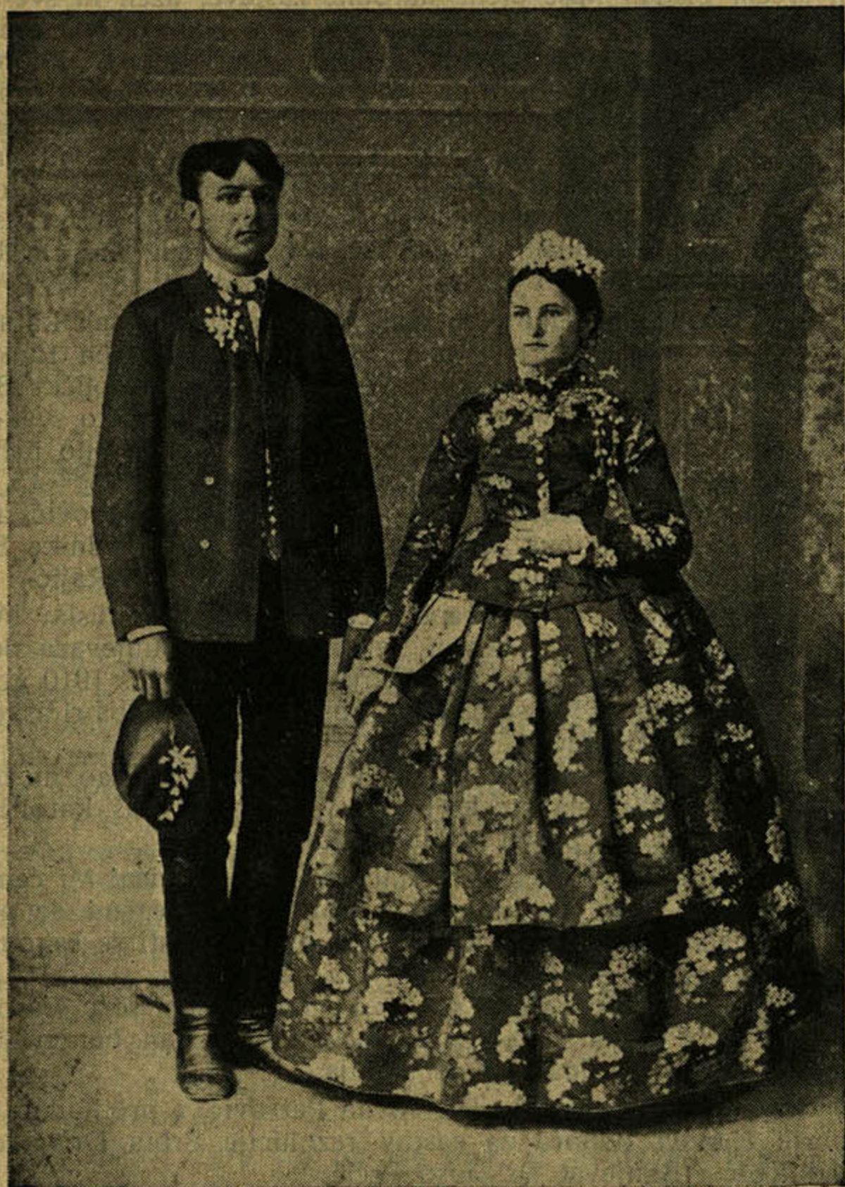
Bunjevački mladi par prije 60 godina