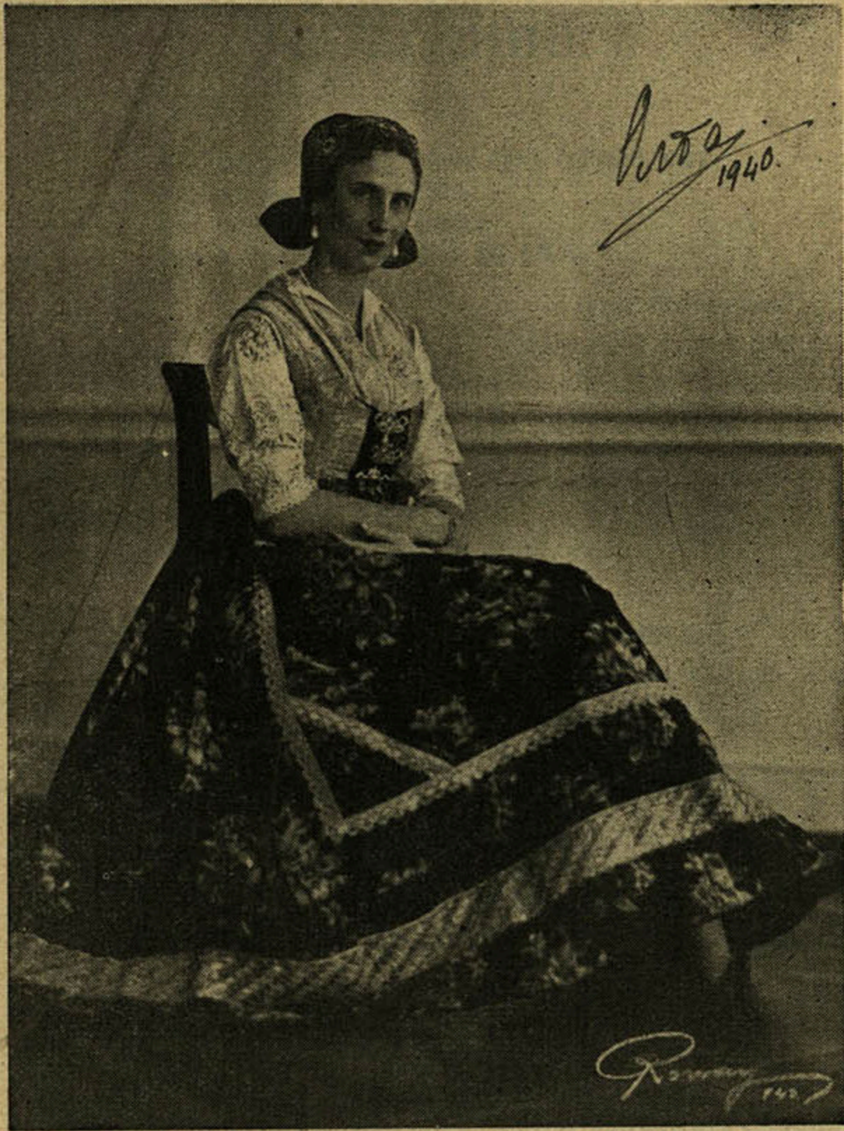
Njeno Kraljevsko Visočanstvo Knjeginja OLGA