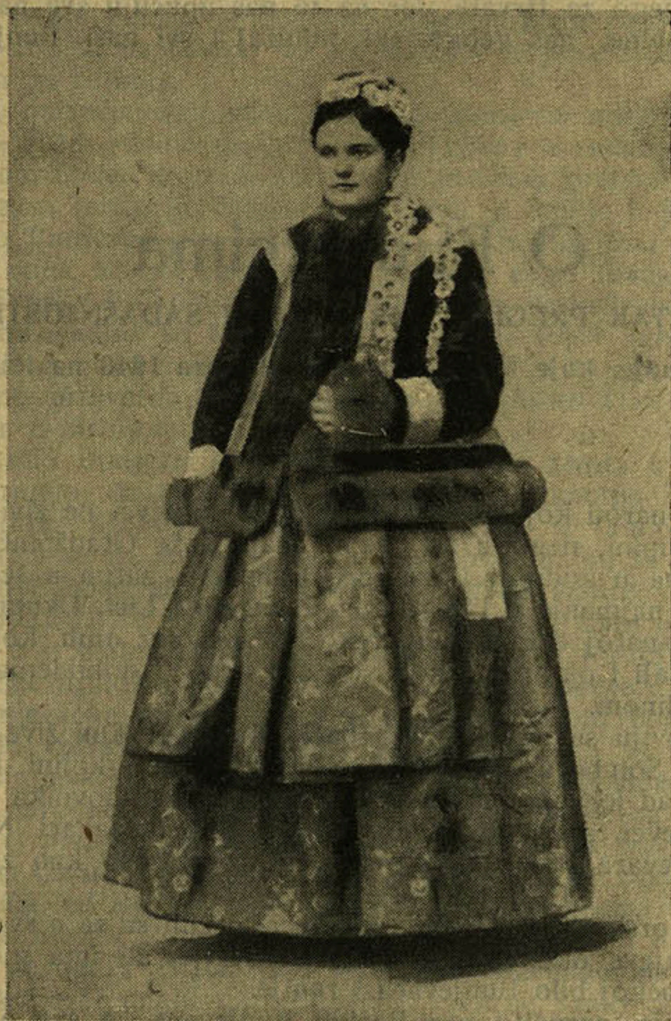
Bunjevačka mlada u „jopki“ prije 60 godina