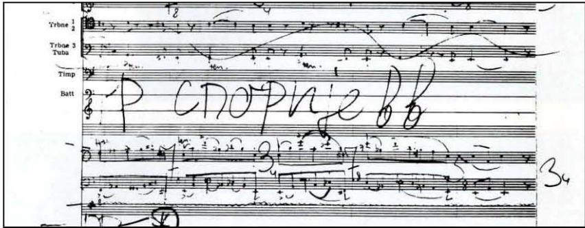
Одломак из Пасакаље