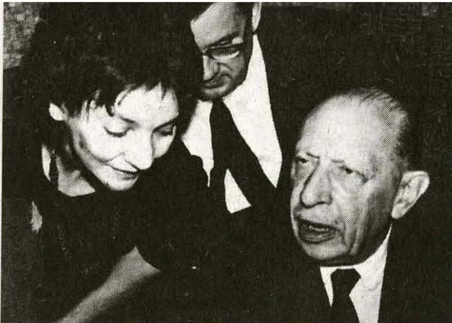
Љубица Марић и Игор Стравински