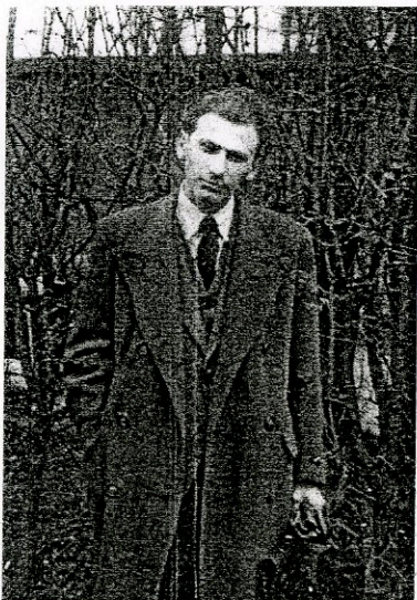
Последња фотографија Миклоша Раднотија