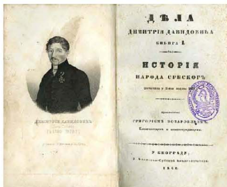
Историја народа србскогъ Димитрија Давидовића