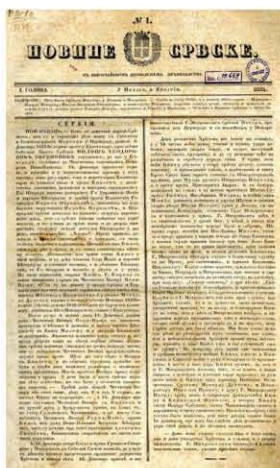
Први број Новина србских