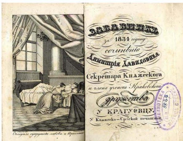
Забавникъ Димитрија Давидовића