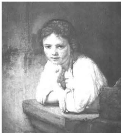
Девојчица на прозору