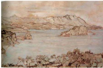
Море, уље на шатну