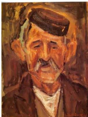
Црногорац, уље на платну