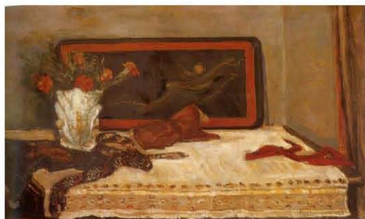
Мртва природа са белом чинијом, уље на платну