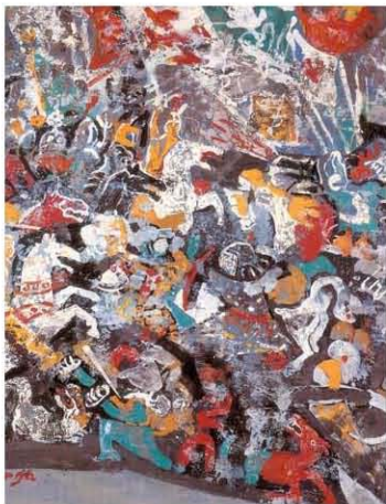
Косовски бој , уље на платну