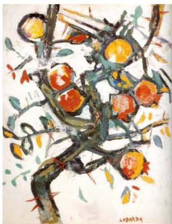
Нарови, уље на платну