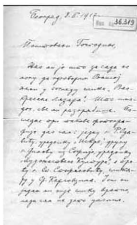
Писмо Уроша Предића Емилу Женару