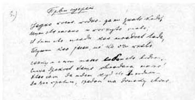
Први сусрет , 1903