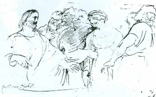
Христос и прељубница