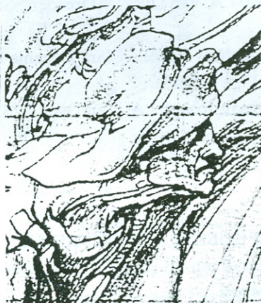
Јудин пољубац, детаљ