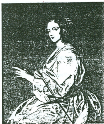
Дама са виолончелом