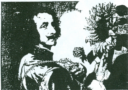
Аутопортрет са суншокретом