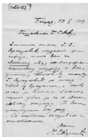
Писмо Јована Скерлића Милану Савићу, 1909