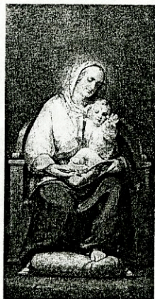
Константин Данил: Богородица