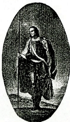
Константин Данил: Свети Ђорђе (иконостас)