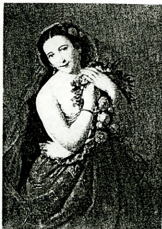
Константин Данил: Флора