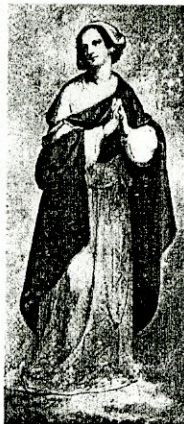
Константин Данил : Богородица