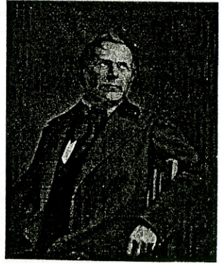
Урош Предић: Портрет Константина Данила

Време у којем настаје, живи и расте сликарска слава Константина Данила обележено је у Европи појавом класицизма и његове крајње фазе "бидермајера" и постепеним успоном романтичарских схватања. Говорено ликовним језиком, био је то сукоб сасвим опречних схватања у организовању слике, сукоб цртачких и сликарских вредности. Док су класицисти истицали увек апсолутно јасну цртачку контуру и линију, романтичари, напротив, гоњени су у правцу поновних откривања интензитета боје и светла, користећи се при томе поукама великих барокних сликара. На уметничком врху ових супротних схватања стоје Енгр и Делакроа, стоји она опоро формулисана Ендрова порука: "Господине, цртање, то је пристојност, господине, цртање је питање части". Па ипак и у табору истомишљеника постојале су разлике. Још понајвише оне долазе до изражаја у схватањима француских и немачких класициста и романтичара.(...)