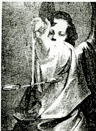
Константин Данил: Арханђел Гаврило (иконостас)