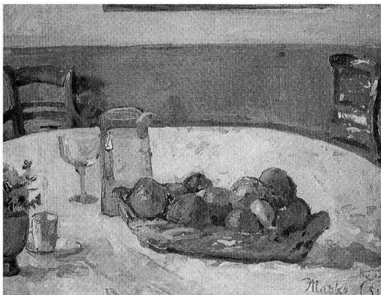
Мртва природа са наранџама, 1951