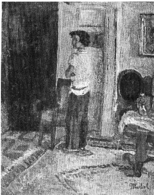
Девојчица у ентеријеру, 1930