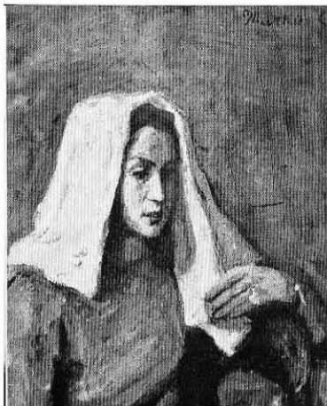
Бели шал , 1935

17. Мртва природа са огледалом , 1972, уље на платну