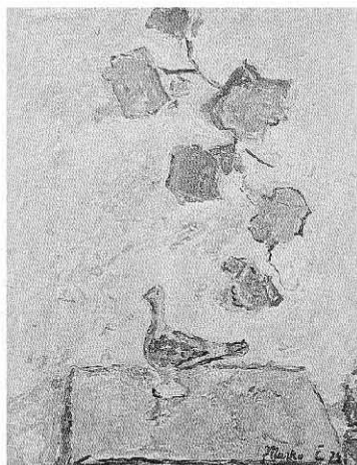
Лишће и птице , 1974