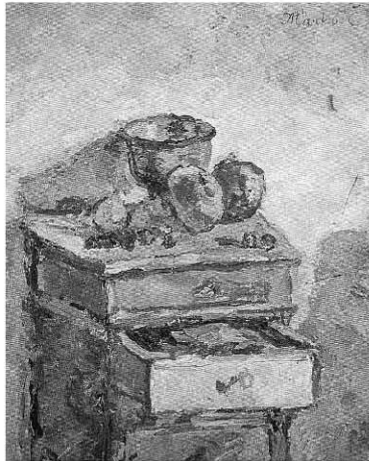
Отворена фијока , 1965-66

16. Отворена фијока , 1965-66, уље на платну