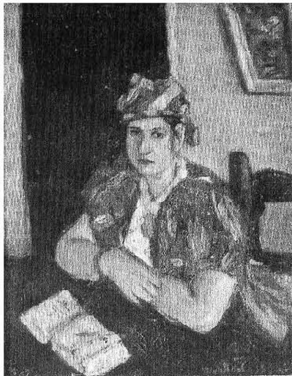
Жена са турбаном, 1935