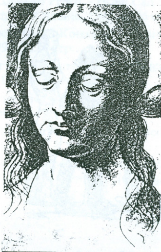
Свѹгија по Леонардо, 1920