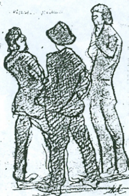
Важна гебаџа, 1923