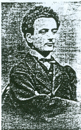
Мита Топаловић, у Бечу 1868