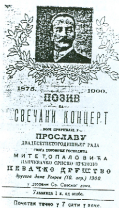
Позив за свечани концерт