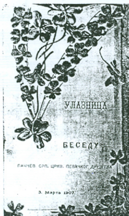
Улазница за Беседу