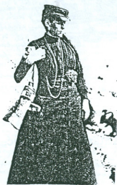
Надежда Петровић, 1913