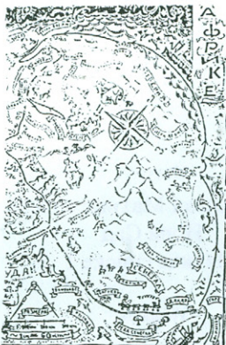
Карта Африке , рад Александра Дерока