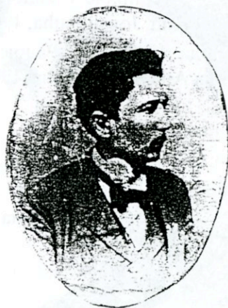
Радоје Домановић из млађих дана