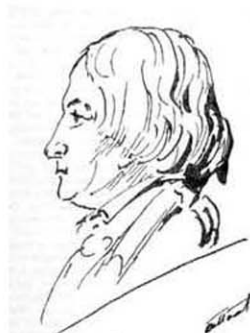
В. Иго: Аутопортрет

Виктор Иго је, по свој прилици, један од највећих књижевних генија свих времена и свих земаља, раван Дантеу, Шекспиру и Гетеу. По својој плодности и по својој разноврсности, међутим, он је јединствен у светској књижевности. Он је био, пре свега, борбени, смели и бучни шеф романтизма, најславније књижевне периоде 19. века, оне која је обновила све књижевне родове, одбацујући сва вековна правила, све ропске угледе и све стеге, и прокламујући слободу уметности и, још више, ослобођење целокупне људске мисли.(...) Слободно се може рећи да нема ниједне идеје која није такла његов дух, ниједног осећања које није прошло кроз његово срце, ниједне чињенице стварности која је измакла његовом истраживању, ниједног кутка невидљивог и тајанственог који он није испитивао, ниједне боје која не блиста, ниједнога мириса који се не излива, ниједнога шума природе који не одјекује у његовим стиховима. У француској књижевности има дубљих мислилаца, који су више продрли у суштину ствари; има песника нежније осетљивости, који изазивају у нашој души слађе и болније емоције; али нема пространијег и разноличнијег духа.