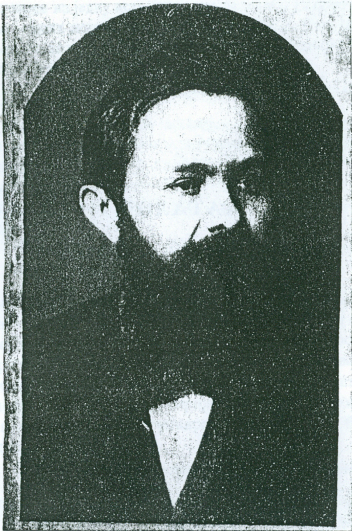
Милован Глишић из млађих дана