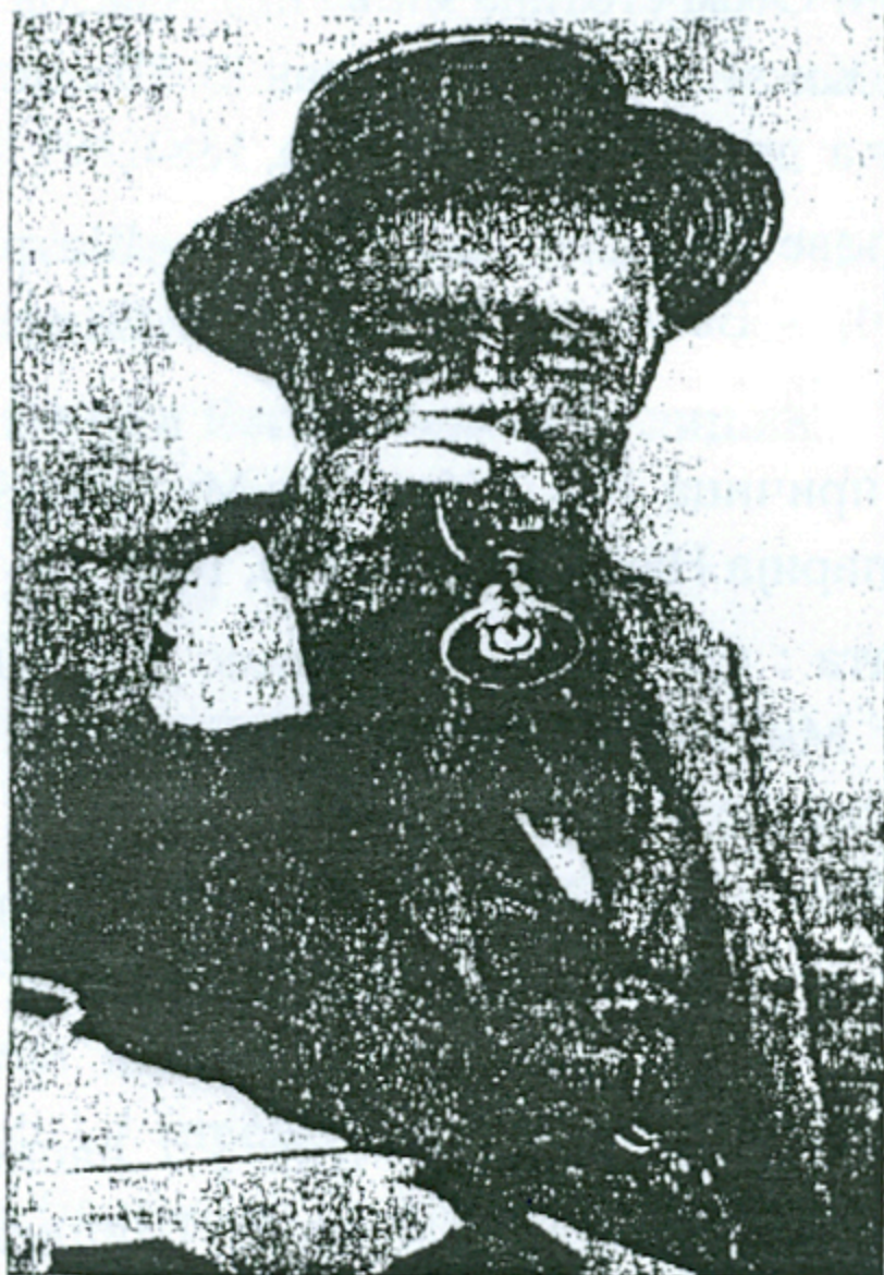
М. Глишић из задњих дана

51. Рат и мир. Књ. 3 / написао Лав Н. Толсти ; превео с рускога Милован Ђ. Глишић. - Београд : Српска књижевна задруга, 1900.