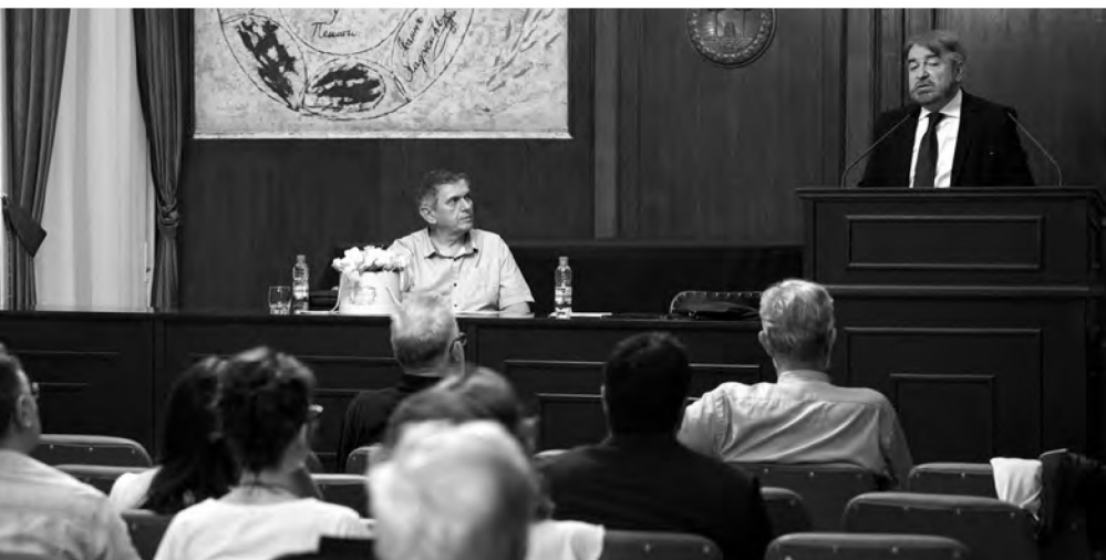
Свечана сала Матице српске, 5. септембар 2019.