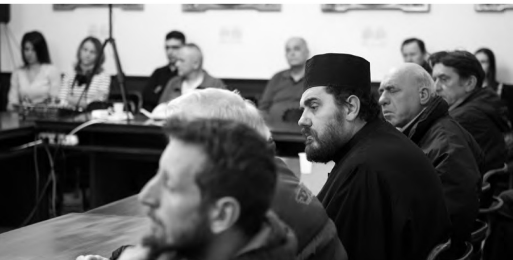
Мала сала Матице српске, 5. децембар 2019.