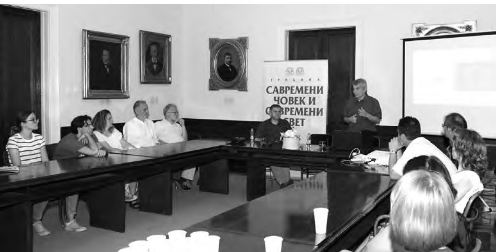
Мала сала Матице српске, 4. јул 2019.