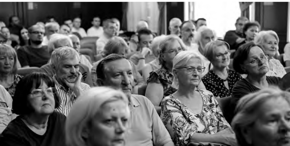
Свечана сала Матице српске, 18. јул 2019.