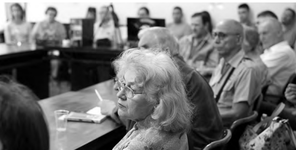
Мала сала Матице српске, 11. јул 2019.