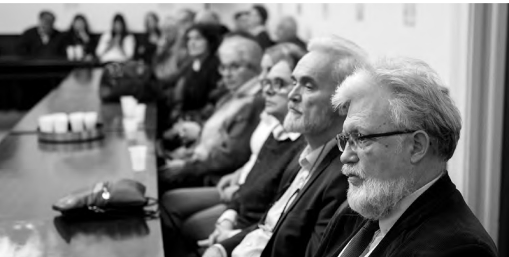
Мала сала Матице српске, 9. децембар 2019.