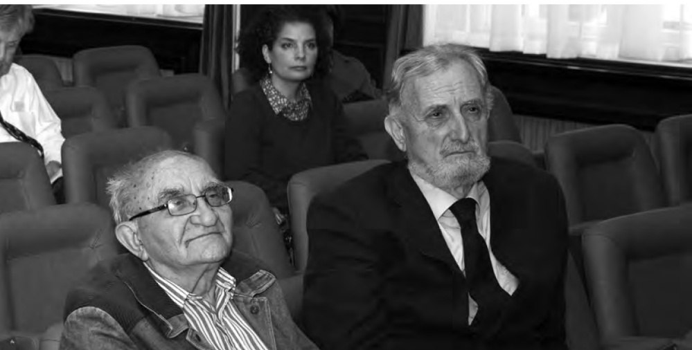
Свечана сала Матице српске, 30. јун 2019.