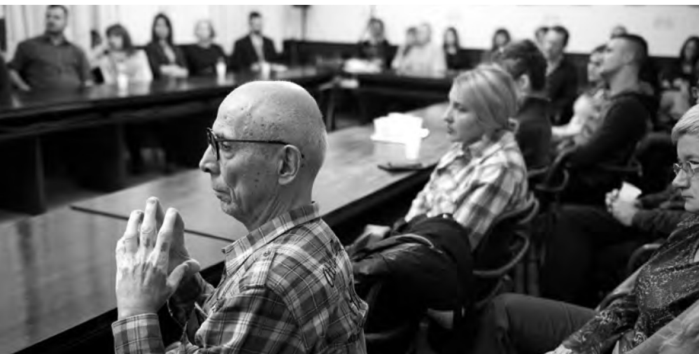
Мала сала Матице српске, 13. новембар 2019.