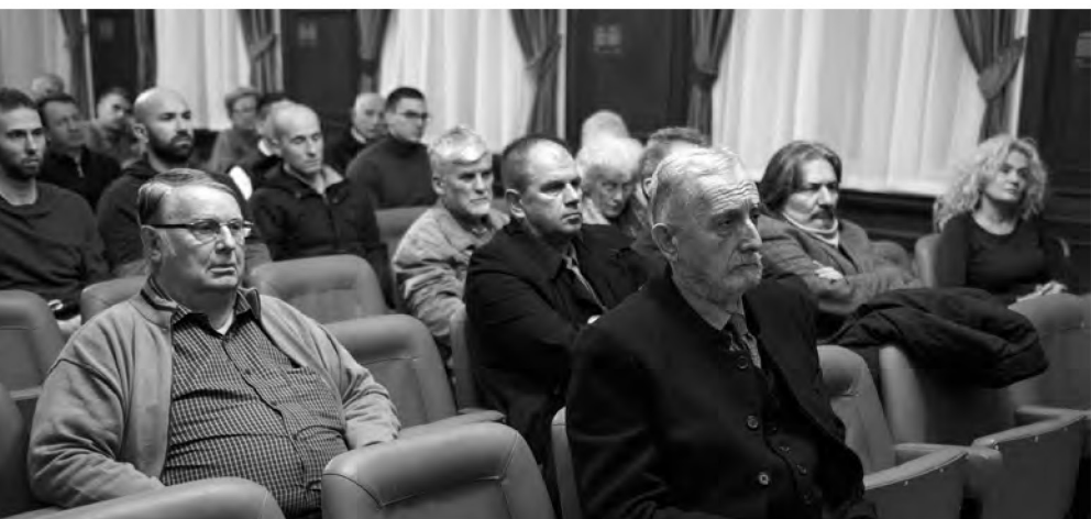
Свечана сала Матице српске, 19. новембар 2019.