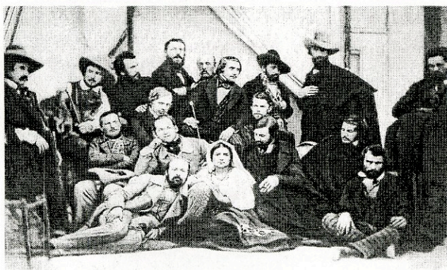
Гогољ с руским уметницима у Риму, 1845.