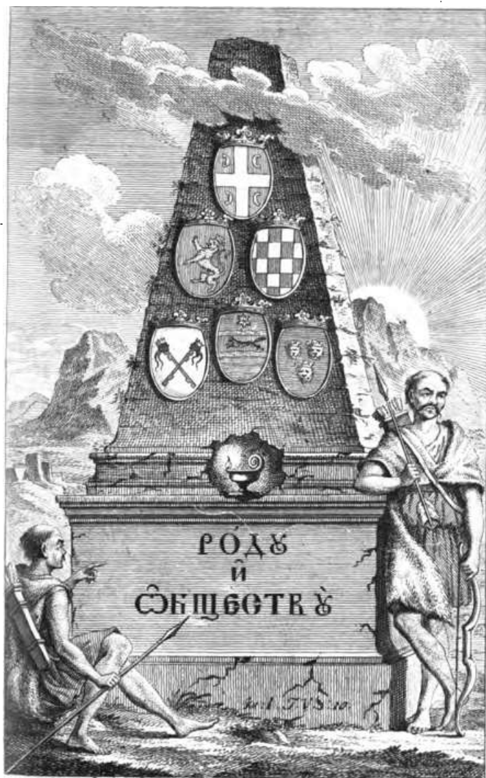
рисоваль Іак. Орфелинъ